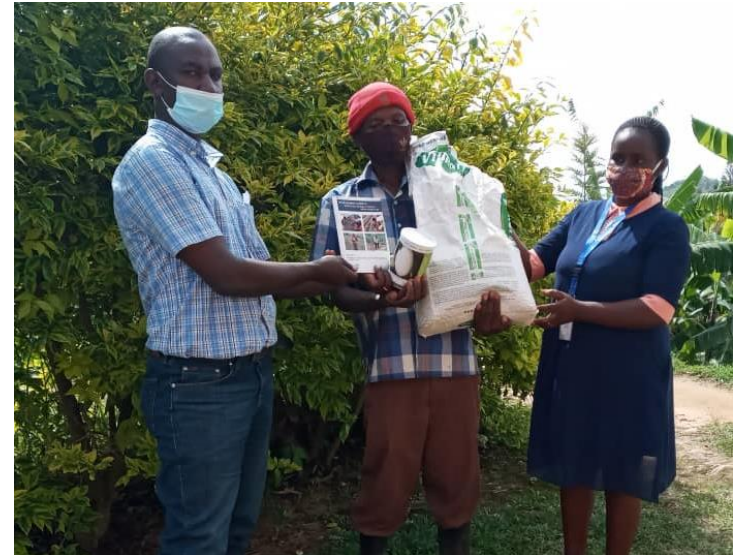
Fornecimento de sementes de produtos hortícolas no Ruanda