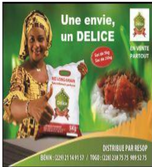
ESOP (sud et centre)

Présentation de quelques marques de riz local : Le label made in BENIN