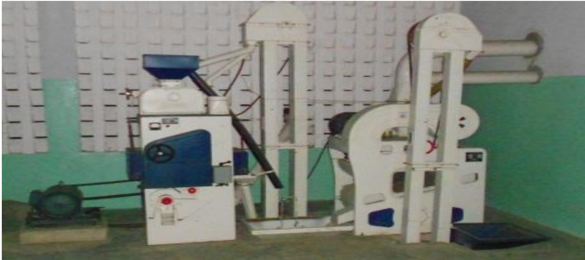
Complexe de transformation dans une mini rizerie