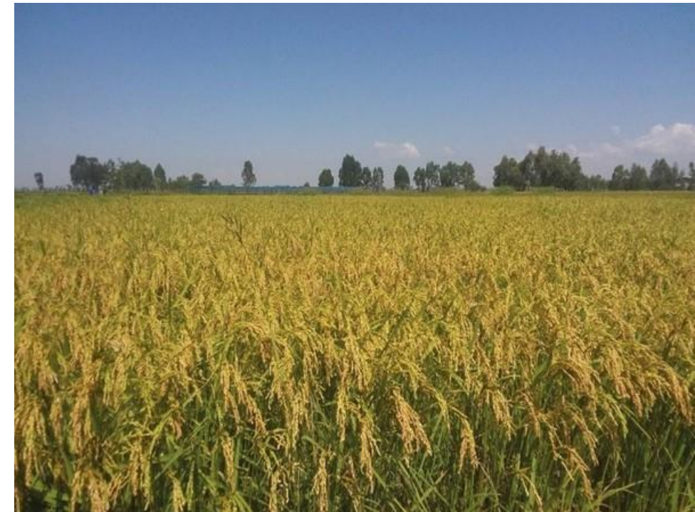
@Mulugeta, Fogera Zona: arroz maduro